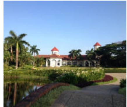
パンライゴルフクラブ

ヤンゴンの名門コース「ヤンゴンゴルフクラブ」ではメンバーの皆様との交流ゴルフを行います。ミャンマーをリードする人たちとの思わぬ出会いから始まることもあるかもしれませんがあるかもしれません。