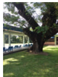
Yangon Golf Club トライピングレンジ