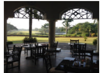
パンラインゴルフコースのテラス