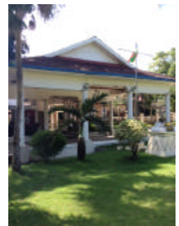
ヤンゴンゴルフクラブ