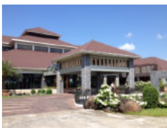
Royal Mingalardon golf Club