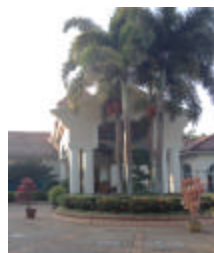
Pun Hlaing Golf Club